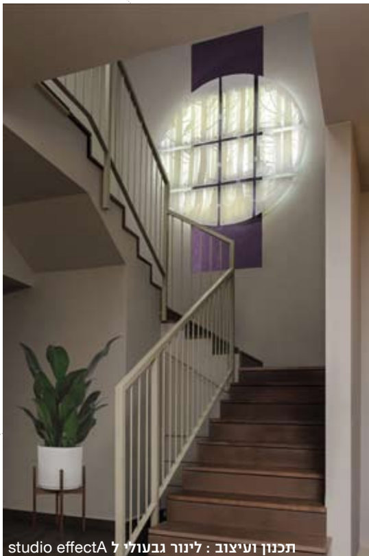
תכנון ועיצוב: לינור גבעולי 7 studio effectA

סדרת עבודות נוספת אשר הוצגה לראשונה בתערוכה "מטבח פתוח" בטקס אות העיצוב 2015 היא קולקציית LAYERED ("מרבד"), גופי תאורה דקורטיביים המציינים סיפור בשכבות של אור וחומר. קולקציה זו היא פרי טכניקה ייחודית המשלבת צילום, ציור וחיתוך לנופים קסומים. מנעד הצורות והגוונים נוצר משילוב של מגזרות נייר זכוכית אקרילית (פקספקס) עם תאורת לד ממוקמת בקפידה. ניתן להרכיב יצירות LAYERED בהתאמה אישית של נושא, סגנון, גודל וסוג תאורה, ממגוון חומרים אחרים המעבירים אוק, פורניק, בד ואפילו אבן שיש פרוסה. עבודת השייזוק, התכנון והפיטוח של StudioKnob נעשית בשיתוף פעולה עם